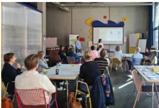
Live-Workshop in Berlin

Am 28.02.2026 folgte ein Live-Workshop in Berlin. Rund 20 Personen lernten mit Unterstützung der „Leibwohl Ernährungsberatung“